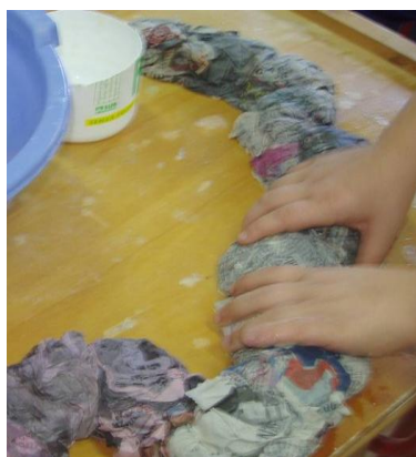
Realizzazione dei rilievi