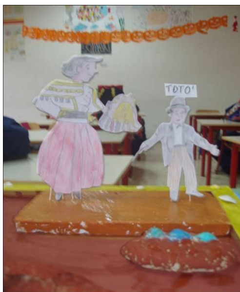
I primi due personaggi