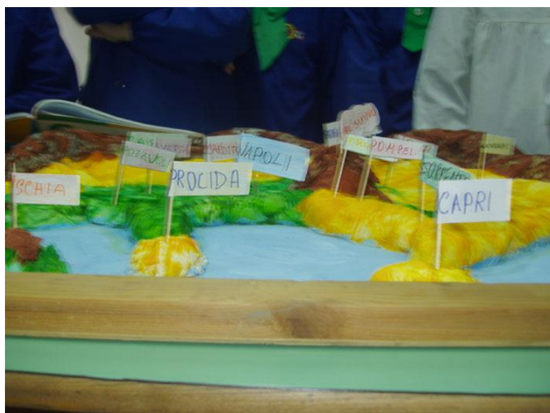
Bandierine di localizzazione