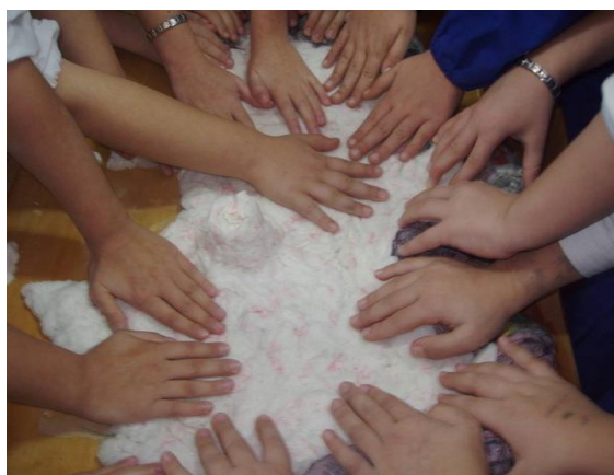
Tutti a "pigiare" la pianura