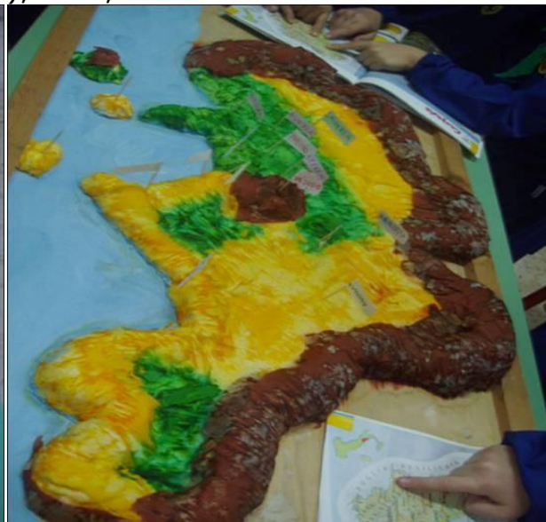
Localizzare e posizionare gli elementi geografici