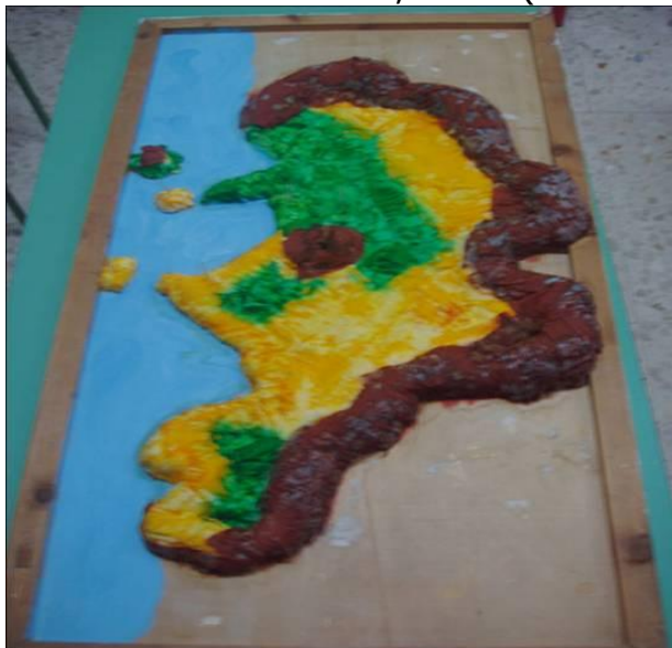
Dare i colori con carta crespata e tempera

posizionano le bandierine caratterizzanti città, centri di interesse storico-culturale, fiumi (nastrino), isole, monti.